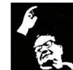
Lycée Salvador Allende HEROUVILLE ST CLAIR